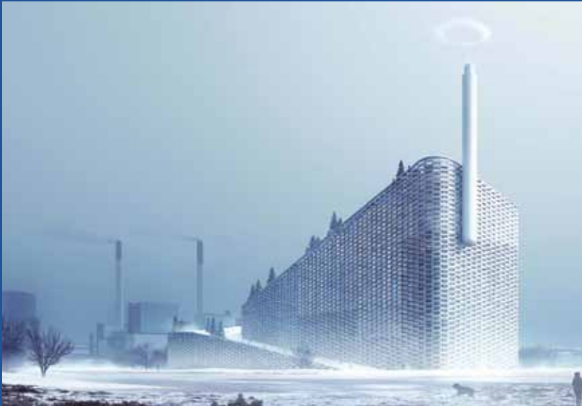
ARG.: BIG – BJARKE INGELS GROUP & MIR