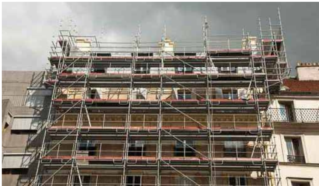
Zaharberritze bat egin ahal izateko, derrigorrezkoa da eraginkortasun energetikoa hobetzea. Horrek kostu handia du, eta arazo bat da herritar askorentzat.

Oronak egin zezakeen, eta egin du, eraikuntza eredugarri baten aldeko apustua. Zoritxarrez, une honetan, ez dago herritar guztien esku apustu hori. ●